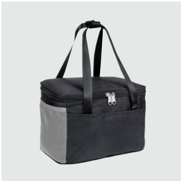
MAL 115 Lonchera Luca