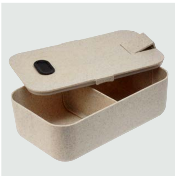
CAS 40 Lunch Box Taurus