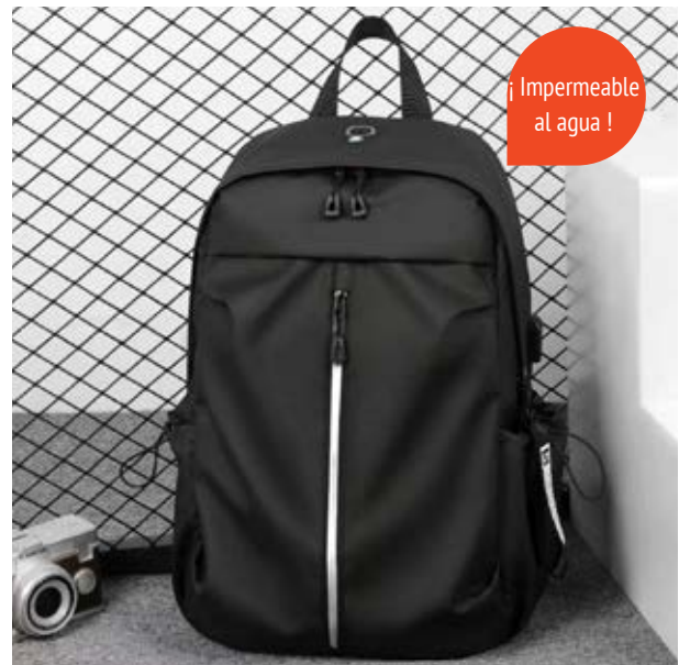
MAL 607 Backpack Kato