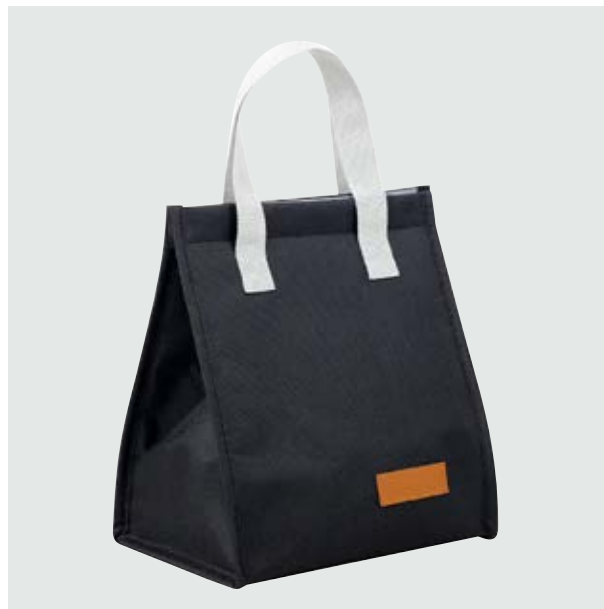
MAL 105 Picnic Bag