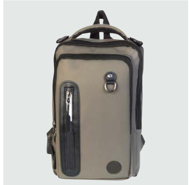
MAL 211 Backpack Baylor

Material: Polyester elastano. Medida: 30 x 19 x 4 cm