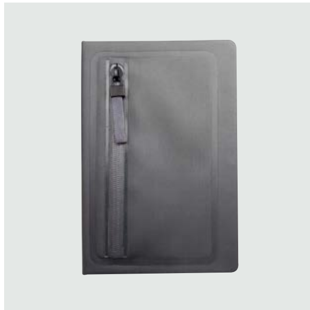
ESC 536 Libreta Denver