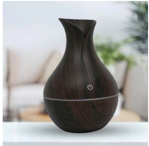
CAS 01 Vaporizador Contempo