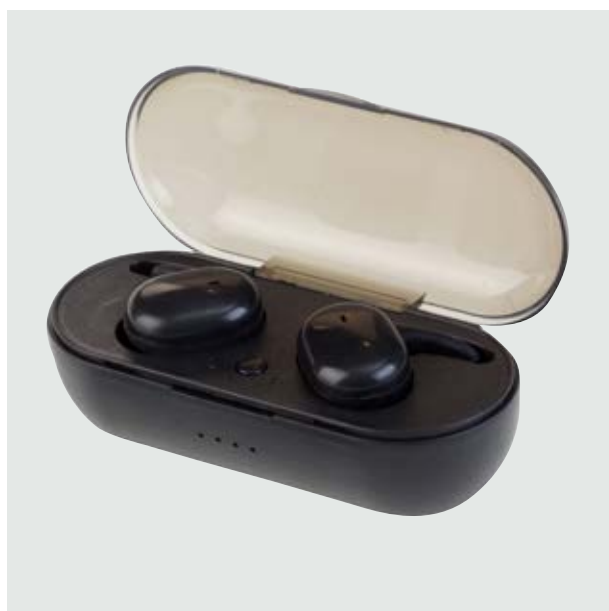
TEC 03 Audífonos Franklin ■