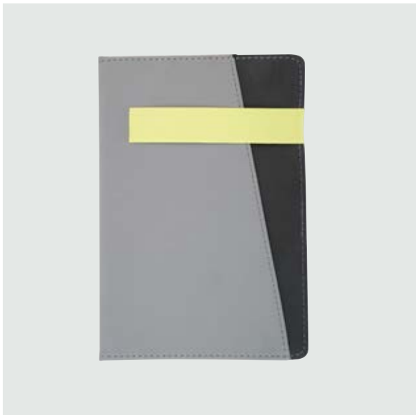
ESC 531 Libreta Moskú