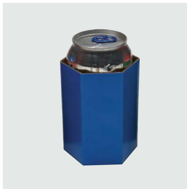
TH 306 Card Can-Holder