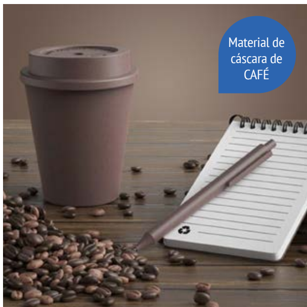
TH 214 Set Coffee Husk