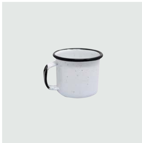
TH 212 Shot-Tequilero