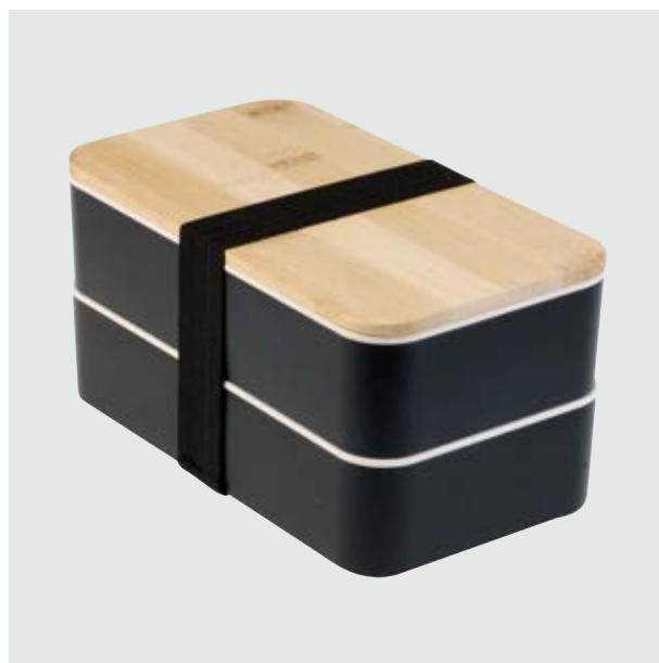
CAS 41 Doble Lunch Box Polaris