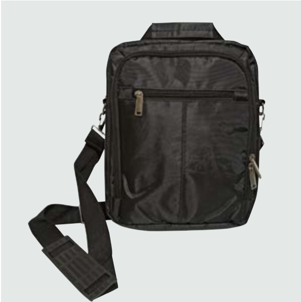
MAL 529 Bandolera Agasi

Material: Polyester Medida: 30 x 23.5 x 4.7 cm.