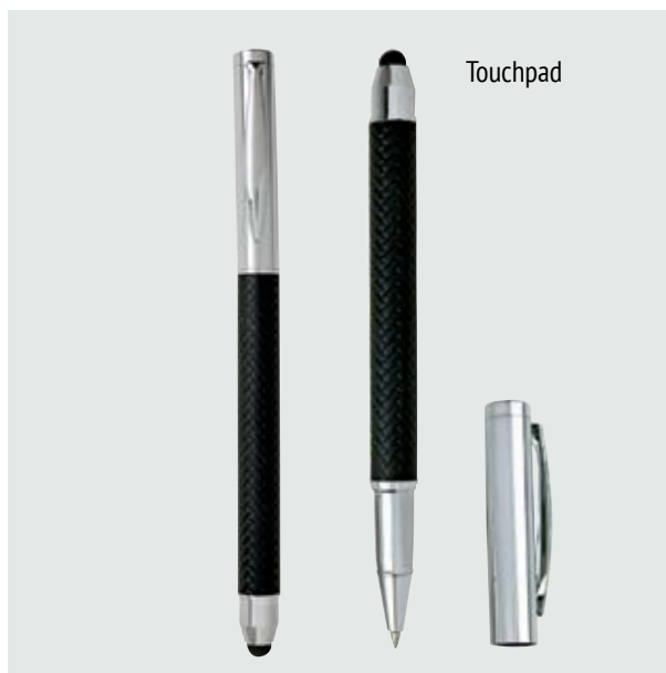
BOL 520 Bolígrafo Bernini