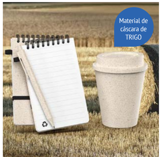
TH 215 Set Trigal