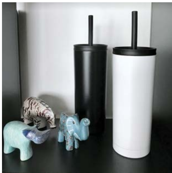
TH 09 Termo Aloe