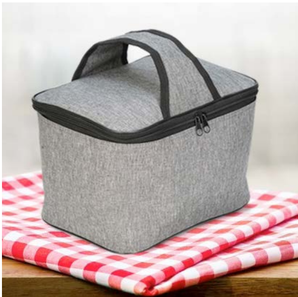
MAL 114 Lonchera Milton