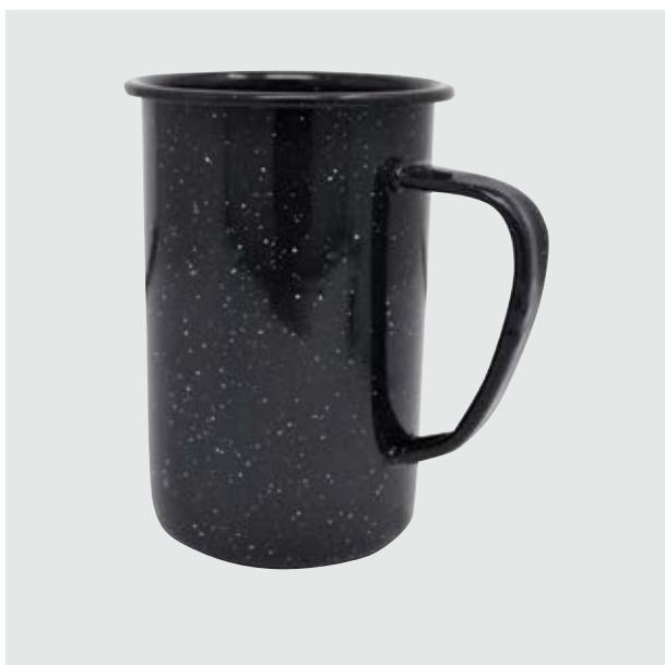
TH 213 Tarro Cervecero